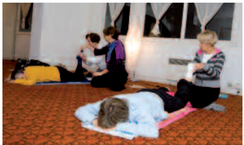
Séance de shiatsu, une pratique manuelle douce et tonique.