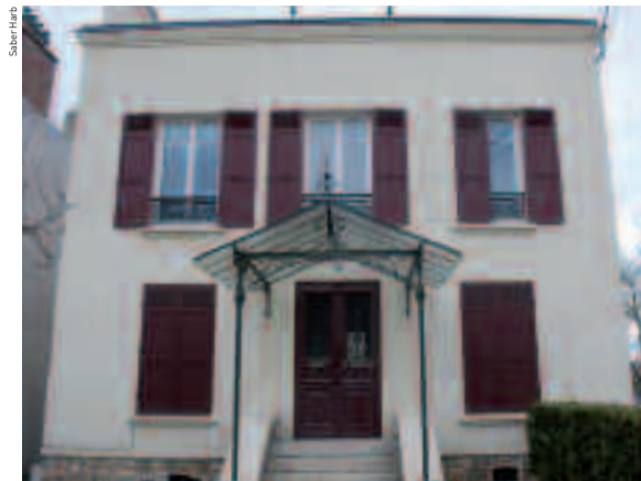
Ancien conservatoire, rue Blaise-Pascal.

Après deux rapports d'inspection, ce n'est qu'en 1983 que le ministre de la Culture répond favorablement au classement de l'école en « école agréée », mais rejette un classement en « école nationale » en raison de ses locaux inadaptés. Au fil des années, l'effectif atteint près de 700 élèves. En août 2003, lors d'une inspection des locaux, il est mis en évidence un fléchissement anormal des plafonds : les poutres sont attaquées par un champignon xylophage redoutable le « mэрule ». La consultation de spécialistes confirme l'état critique du bâtiment. Après la pose d'étais destinés à le sécuriser, il est décidé de ne plus utiliser ces locaux. Début 2004, la municipalité décide d'acquérir dans les meilleurs délais un complexe modulaire. Cette infrastructure, loin d'être idéale,