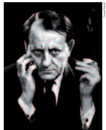
André Malraux (1901-1976).

la guerre civile d'Espagne. Il en rapporte le roman L'Espoir (1937). Résistant pendant l'occupation allemande, il dirige la brigade Alsace-Lorraine. Après la guerre, Malraux entre en politique aux côtés du général de Gaulle, qu'il soutiendra avec passion et fidélité. Lors du retour au pouvoir du Général, en 1958, il fonde le ministère des Affaires culturelles et en prend la direction jusqu'en 1969. Ce n'est qu'avec le départ de de Gaulle que l'écrivain renonce à toute activité politique, sans toutefois cesser d'écrire. Il se livre alors à une vaste réflexion sur la condition de l'homme. Il s'éteint à Créteil, en 1976. Ses cendres sont conservées au Panthéon. ■