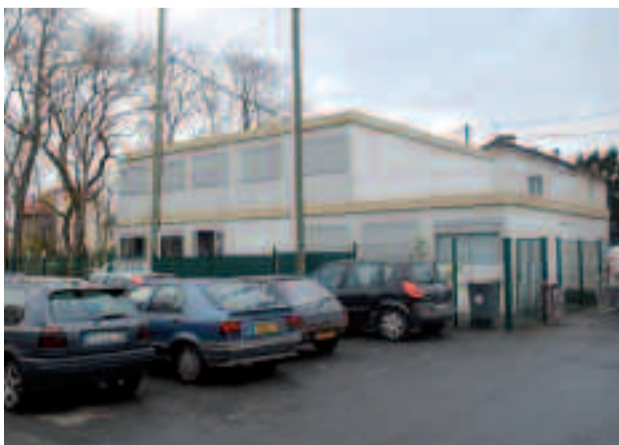
Complexe modulaire, rue Séverine.

En raison de l'avancement des travaux d'aménagement du quartier de l'Église, la Ville est tenue de libérer le parking, rue Séverine, où se trouve actuellement le complexe modulaire. L'ensemble de l'installation sera donc déplacé durant l'été pour être transféré rue du Président-Kennedy, à proximité du gymnase Franco-Brondani. Les activités du conservatoire se poursuivront sur ce nouvel emplacement dès septembre 2009. S'y ajouteront d'autres modules pour accueillir les activités qui ont lieu à l'école Maurice-Velter.