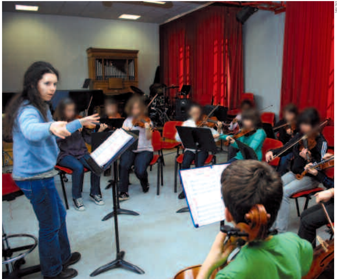
Le conservatoire de musique et de danse accueille actuellement 670 élèves de tous âges et de tous niveaux. Ils bénéficient d'un enseignement de qualité dispensé par 38 professeurs.

D'une surface utile de 746 m 2 (superficie totale de 1050 m 2 ), le nouveau conservatoire comportera trois