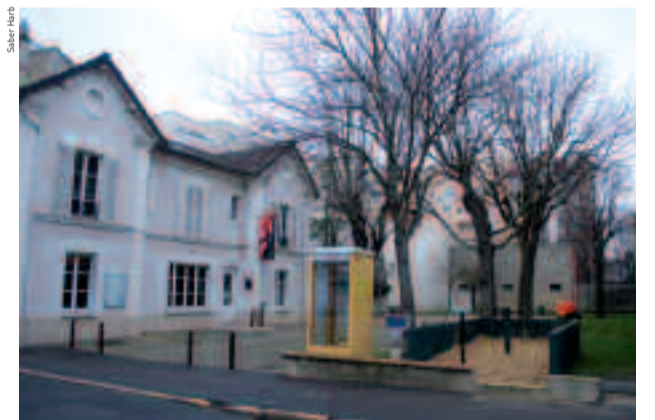
Localisation du futur conservatoire, rue Gambetta.

Au premier étage, on trouvera les salles des enseignements théoriques, la salle des professeurs et les locaux