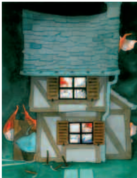
Illustration de Quentin Greban (Blanche-Neige, conte des frères Grimm).

« Graines d'histoires ». Entrée libre, jusqu'au 10 avril. Lundi, mardi, jeudi et vendredi, de 14 h 30 à 18 h ; mercredi et samedi, de 14 h 30 à 19 h. Une visite contée est organisée samedi 4 avril, à 14 h 30 (à partir de 5 ans, gratuit sur inscription). Maison Jules-Verne (7, rue du Capitaine-Guise). Renseignements au 01 30 86 33 82.