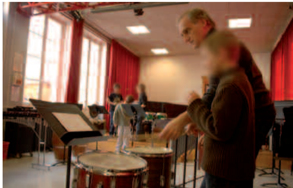
Cours collectif de percussions.

Conservatoire de musique et de danse à rayonnement communal (11 bis, rue Séverine). Renseignements au 0139 68 61 80.