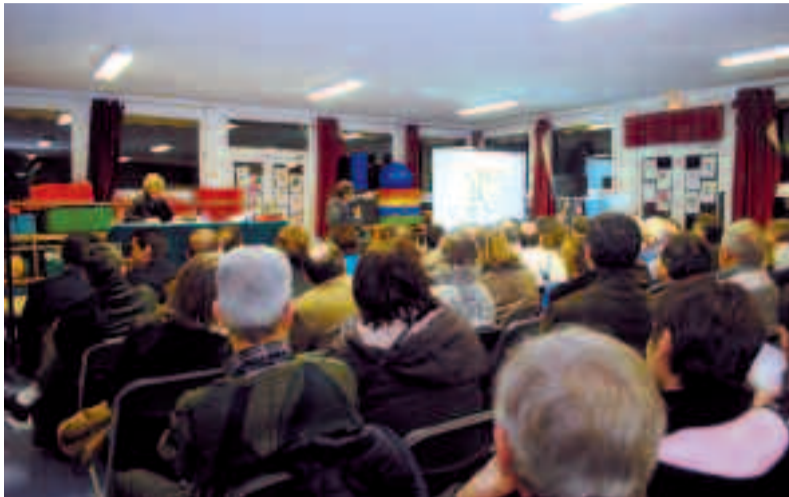
Près de 150 riverains des quartiers des Pierrats-Tonkin étaient présents à l'école Lucien-Waterlot.

Le cycle des réunions de quartier s'est poursuivi, le 12 février, avec les Pierrats-Tonkin. Près de 150 riverains étaient présents à ce 65 e rendez-vous qui se tenait à l'école Lucien-Waterlot. Au cœur des débats : le squat de la zone Sarazin, boulevard Jean-Jaurès. L'occupation illégale par des familles roumaines de cette ancienne friche industrielle (destinée à accueillir une future zone d'activité commerciale) a en effet été le principal sujet de préoccupation. Des riverains du boulevard Jean-Jaurès et de la rue de l'Yser avaient d'ailleurs été invités par le biais d'un tract anonyme à venir nombreux à cette rencontre pour manifester leur mécontentement. Les habitants ont ainsi fait part au Maire de leurs inquiétudes et de leurs interrogations sur le squat. Le Maire a rappelé que le site était une propriété privée et qu'une procédure d'expulsion avait été engagée par le propriétaire des lieux. « La