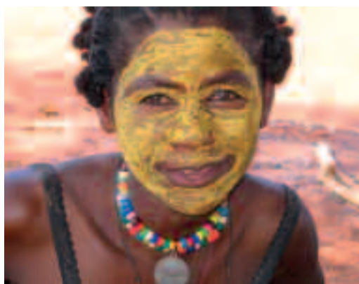
Jeune femme Bochiman.

Cependant, face à la pression d'un monde moderne de plus en plus présent, cette famille ethnique tend à disparaître et à se sédentariser. Malgré cela, bon nombre d'entre eux continuent plus que jamais de s'accrocher à leurs traditions de chasse et de cueillette, comme nous le