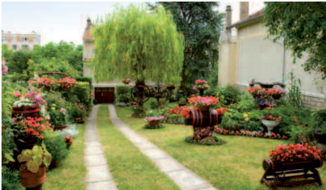
Premier prix 2008 dans la catégorie « Maisons avec jardin, visible de la rue ».

Les beaux jours reviennent, les premières fleurs commencent à éclore. C'est le printemps! Et le mois d'avril sonne comme une invitation au jardinage. Alors, n'hésitez pas, l'édition 2009 du concours départemental « Balcons et maisons fleuries » vous donne l'occasion de laisser libre cours à votre inspiration.