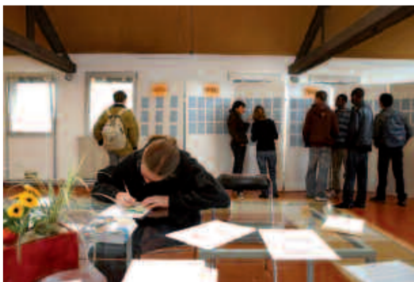
Le Forum, le 4 avril, au Ginkgo, permettra aux jeunes d'accéder à des offres d'emploi pour la période estivale.

Un emploi saisonnier, c'est ce que recherchent de nombreux jeunes durant la période estivale. C'est à leur intention que Houilles information jeunesse (HIJ) organisera, le samedi 4 avril, le « Forum jobs d'été ». Cette 6 e édition se tiendra, de 10h à 18h, au Ginkgo où seront réunis de nombreux partenaires, favorisant la rencontre entre étudiants et professionnels. Ce sera aussi l'occasion de consulter des offres (locales, nationales et européennes) dans des secteurs aussi variés que le tourisme, la grande distribution, l'hôtellerie, la restauration, l'animation... Les conseillers de la mission locale