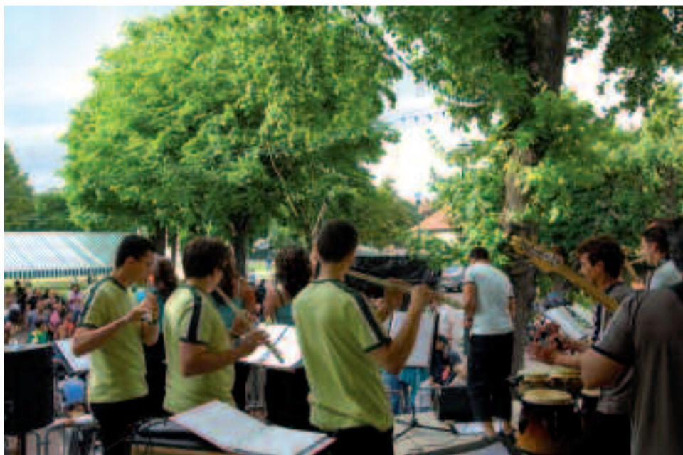
Une des deux scènes ouvertes : le kiosque à musique du parc Charles-de-Gaulle.

Événement incontournable de l'été, la 26 e édition de la Fête de la musique se tiendra le 21 juin.