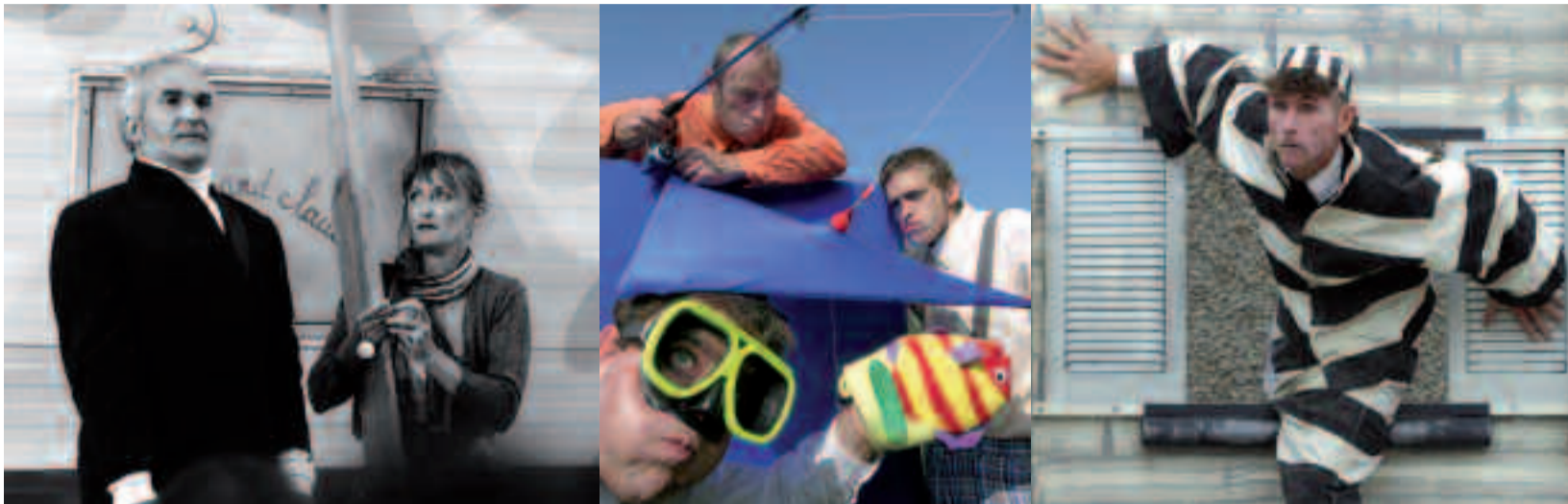
Une succession de spectacles insolites mêle dérision, humour et inventivité.

Honneur aux cultures urbaines ! Arts de la rue, slam, danse hip-hop et théâtre seront célébrés par des artistes professionnels et amateurs. Rendez-vous, le 16 juin, dans le parc Charles-de-Gaulle.