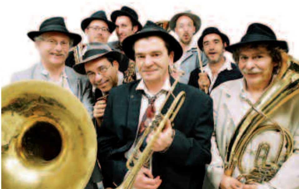
Les Taraf Goulamas proposent des compositions originales mijotées entre petits plats, musiques tziganes et joie de vivre.

Deux groupes ensoleillés viennent fêter, le 9 juin, l'été qui arrive à grands pas. Les Taraf Goulamas, fanfare culinaire tzigane, et la Fraternelle des cornemuses du Centre débarquent pour un concert sous les étoiles.