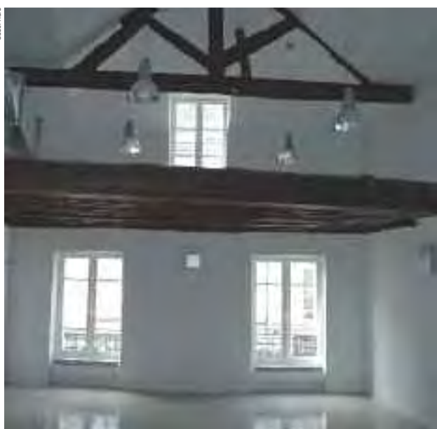
Salle réservée aux activités de l'Atelier 12.

La Graineterie (27, rue Gabriel-Péri). Renseignements : 01 30 86 33 82.