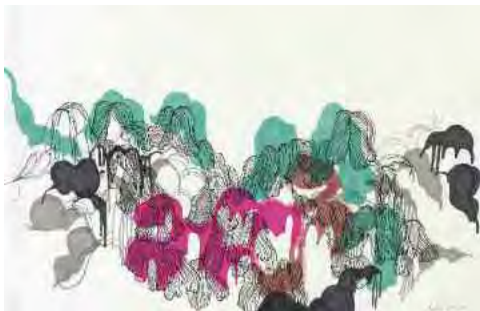
Torso Corso, œuvre du collectif Qubo Gas.

Boojum, création de l'artiste américaine Gail Wagner.