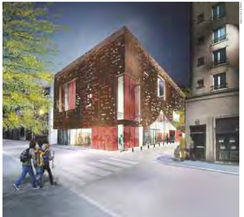
Projet architectural du futur conservatoire de musique et de danse (vue de la façade extérieure donnant sur la rue Gambetta).

œuvre afin de pouvoir rattraper au mieux les cours qui n'auront pas pu être assurés. À noter que, du 7 septembre au 17 octobre, certains cours de pratique collective se tiendront dans l'auditorium tandis que les cours de danse classique et de danse contemporaine reprendront à compter du 14 septembre au Triplex. Du 21 septembre au 12 octobre, les usagers pourront contacter l'équipe du conservatoire au 06 30 66 39 25.