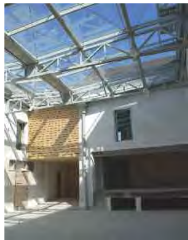
Le bâtiment est organisé autour d'une cour pavée centrale, d'une superficie de 150m 2 , recouverte par une vaste verrière.

sculpture, la photographie, l'art vidéo, les nouvelles technologies, les installations multimédias, les formes hybrides... », précise Gilles Dresse, directeur des affaires culturelles de la Ville.