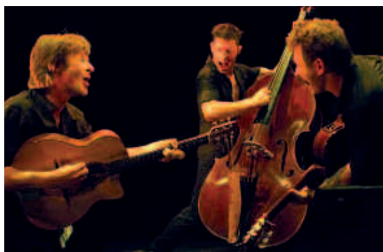
Le trio explosif du groupe manouche Samarabalouf.

Samedi 24 mai, à 20h30. Gratuit. Kiosque du parc Charles-de-Gaulle. Bar et restauration légère sur place. Renseignements au 01 30 86 33 82 (service culturel).