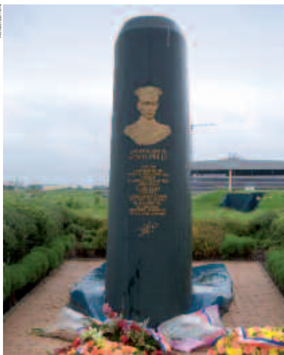
Stèle dressée en hommage au commandant Millé, représentant le kiosque du sous-marin Protée.

décorent son bureau. Depuis deux ans, il administre la base où travaillent chaque jour plus de 500 personnes (308 militaires et 228 civils de la Défense). Il gère toute la logistique et la sécurité du site, secondé par une brigade de gendarmerie maritime, des marins-pompiers et une compagnie de fusiliers marins. Des spécialistes de la protection des zones militaires sensibles. Car l'endroit est un site militaire de 35 hectares,