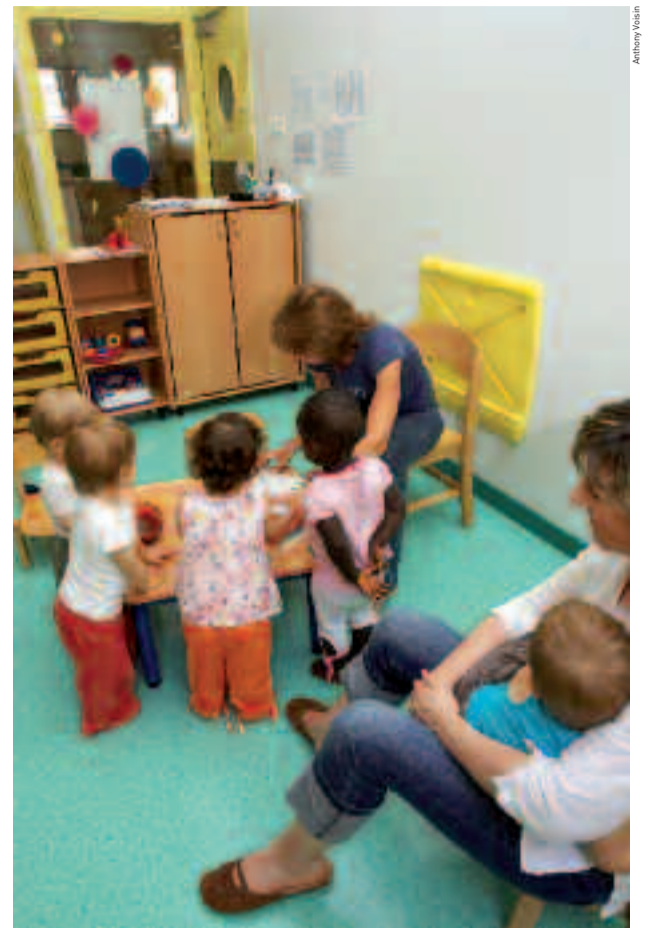
Pour toutes les prestations municipales, le quotient familial détermine la participation de chaque foyer en fonction de ses ressources.

Service des affaires scolaires (annexe de la mairie, parc Charles-de-Gaulle). Renseignements au 01 30 86 33 75 / 33 76 / 33 77.