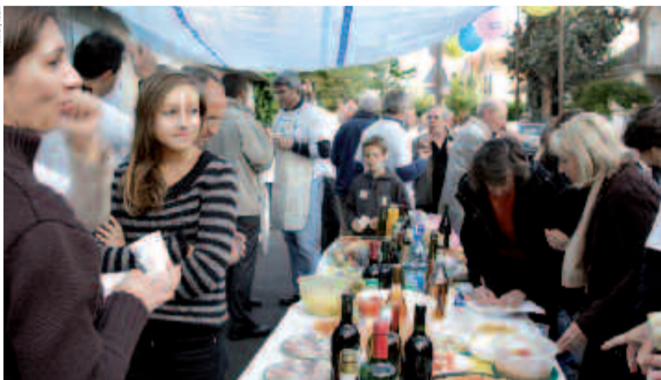
La Fête des voisins, un moment privilégié de rencontres et d'échanges.

O n ne présente plus la Fête des voisins ! Cet événement, ô combien convivial, aura lieu le soir du mardi 27 mai. Initialement connue sous le nom de « Immeubles en fête », cette manifestation représente un moment privilégié dédié à la convivialité, aux rencontres et aux échanges de proximité avec ses voisins. Une nouvelle fois, les Ovillois sont invités à organiser ce moment festif autour d'un buffet, d'un pique-nique ou d'un barbecue à partager dans le lieu le plus adapté : cour, hall d'immeuble, placette, jardin d'un pavillon... Afin de promouvoir cette manifestation, le service communication de la Mairie met à la disposition de toutes les personnes qui