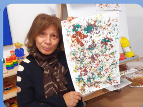
Feux d'artifice d'automne aux rouleaux papier toilette