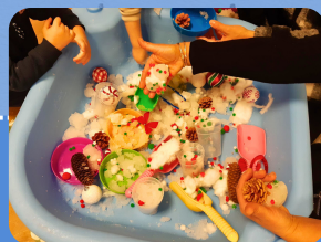
Ateliers Festifs, semaine sensorielle