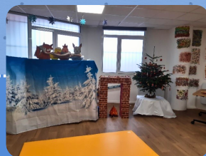
La fête du RPE 14/12/23 « Juste un petit bout »