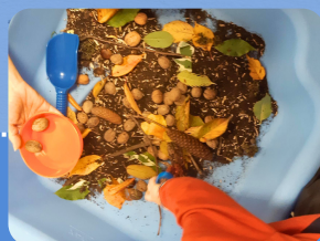
Ateliers sensoriels d'automne