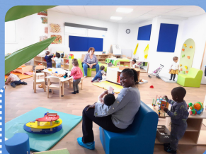
Relais petite enfance

thème blanc, semaine sensorielle, semaine créative, semaine motricité.