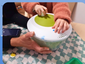
Ateliers festifs, semaine créativité