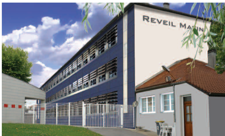
École élémentaire Réveil-Matin : projet de réhabilitation des façades et de la toiture.

façades et de la toiture ; réalisation de deux salles de classe, création d'un préau) ; école maternelle Lucien-Waterlot (création d'un réfectoire, réhabilitation des sanitaires, création d'une cinquième classe) ; école élémentaire Maurice-Velter (réfection des peintures, remise à neuf de l'éclairage, isolation des fenêtres, remplacement du système de sécurité incendie) ; école Salvador-Allende (réfection de la cour, remplacement de jeux sur ressort, mise en place d'un visiophone). ■