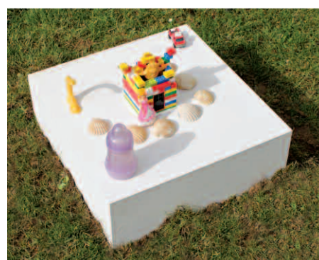
Les Ovillois peuvent déposer l'objet de leur choix sur des socles installés à l'extérieur.

leurs œuvres à La Graineterie. En parallèle, et dans le même temps, les Ovillois sont associés au processus de création en s'appropriant des socles installés à l'extérieur, dans différents lieux de la ville (jardin de La Graineterie, parc Charles-de-Gaulle, square Saint-Nicolas). Ils peuvent y déposer l'objet de leur choix et le photographier pour une parution sur le site Internet de La Graineterie (photo à adresser à pole.culturel@ville-houilles.fr ). Placé sur un socle, tout objet, aussi anodin soit-il, accède ainsi au statut d'œuvre d'art ! ■