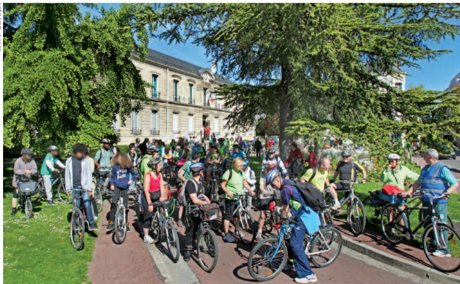
Houilles est une des villes étapes de la Convergence francilienne.

Convergence francilienne 2014 : rendez-vous, dimanche 1 er juin, à 10 h 15, devant la mairie de Houilles (16, rue Gambetta). Informations sur www.mdb-idf.org