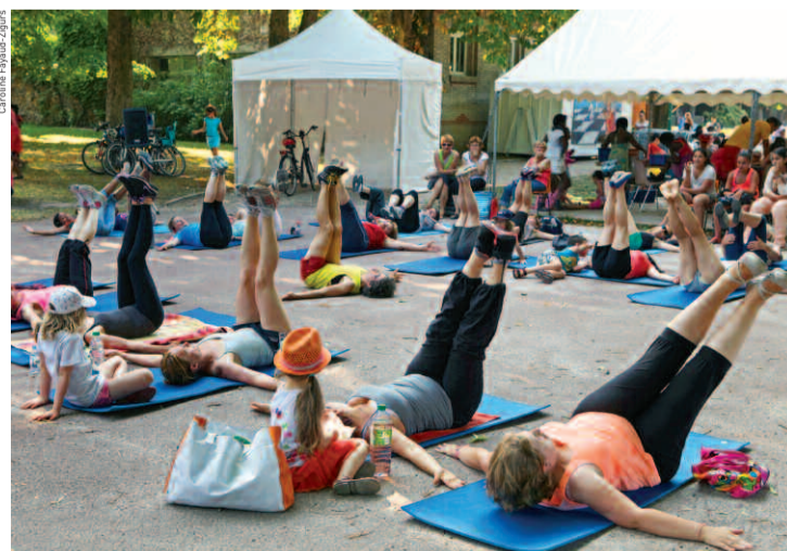
Animations sportives pour les adultes, en juillet et en août.

> Du 16 juin au 6 juillet (tous les jours de 16 h 30 à 19 h 30, sauf les mercredis et les week-ends). > Du 7 juillet au 6 septembre (tous les jours de 10 h à 19 h 30, sauf les 13 et 14 juillet). Parc Charles-de-Gaulle. Programme détaillé sur le site : www.ville-houilles.fr