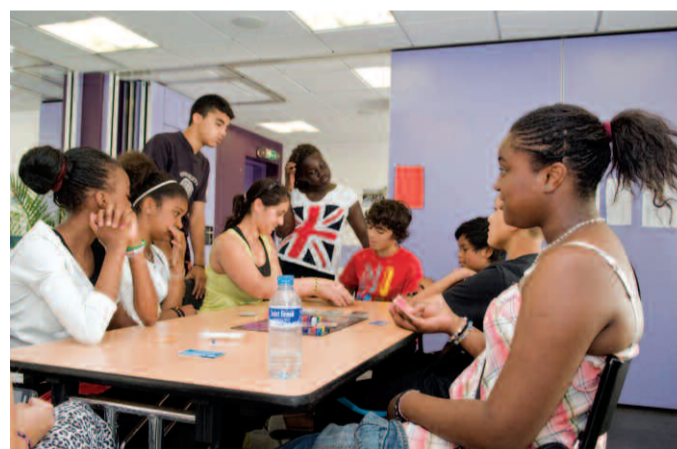
Animations au Ginkgo pour les 11-17 ans.

proposer et de faire découvrir aux enfants de nouvelles activités, en les incitant à établir eux-mêmes leur programme, en accord avec leurs animateurs. Un mini-séjour avec hébergement en camping leur sera également proposé. Il se déroulera à Merlimont-Plage (Pas-de-Calais), du 21 juillet au 25 juillet. Les enfants seront accueillis au centre Les Argousiers. Situé au cœur d'un espace naturel, le site offre un cadre de vacances idéal. Au programme : jeux, découverte de la nature, pêche à pied, baignade et grande plage de sable fin.