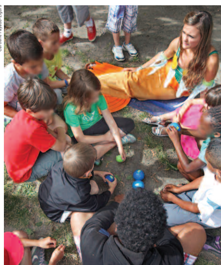
Le centre de loisirs Cousteau accueille les 6-13 ans à partir de juillet.

Durant tout l'été, les enfants des écoles primaires âgés de 7 à 10 ans peuvent bénéficier d'un accueil à la carte à l'espace Toussaint-Guesde. Ils y sont accueillis du lundi au vendredi sur le principe de la demi-journée (pas de déjeuner sur place). En règle générale, les matinées sont consacrées à des stages et à des ateliers thématiques : activités physiques, activités manuelles, arts plastiques (initiation à la cosmétique bio, à la customisation de tee-shirts, au scrapbooking...). L'idée maîtresse est de