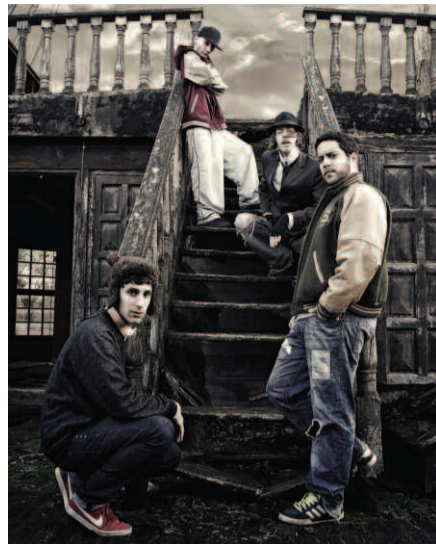
Invité d'honneur de la Fête de la musique : le groupe Scarecrow.

H ip-hop, jazz, rock, soul, funk, slam... Le 21 juin, Houilles fête toutes les musiques. Rendez-vous parc Charles-de-Gaulle pour un vrai moment de partage musical.