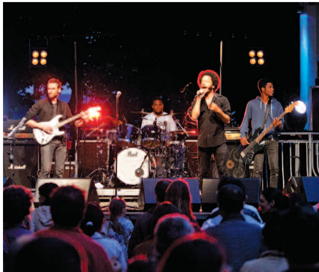
En première partie de soirée, la scène sera réservée aux groupes locaux.