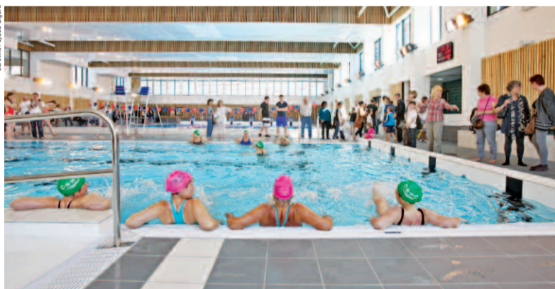
La piscine intercommunale, un lieu de détente idéal pour tout l'été !

D epuis le 19 mai, la piscine intercommunale de la communauté de communes de la Boucle de la Seine est ouverte au public. Ce nouvel équipement sportif, situé à Houilles, dans le quartier du Tonkin, est conçu pour assurer aux usagers des conditions optimales pour l'initiation et la pratique d'activités aquatiques, qu'elles soient sportives ou de loisirs. Ce nouvel espace qui s'étend sur une surface totale de plus de 3000 m 2 comprend un bassin sportif de 375 m 2 avec 6 lignes d'eau de 25 m, un bassin d'apprentissage de 250 m 2 réservé à la découverte et à la détente et, pour les amoureux du farniente, un solarium minéral