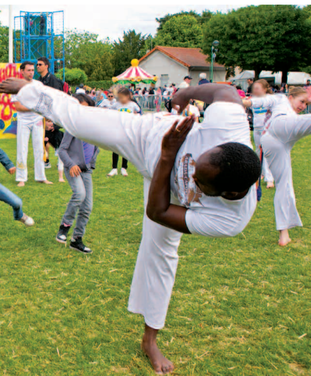
De nombreuses activités seront proposées sur le thème du Brésil. Parmi elles, la capoeira, l'art martial brésilien.