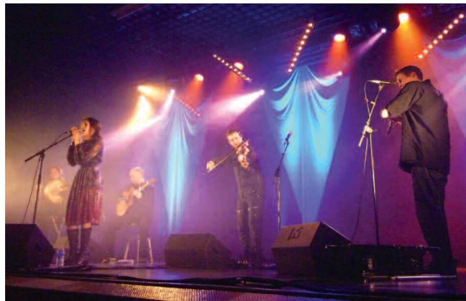
Le groupe Owen's Friends revisite les musiques traditionnelles celtiques.

L e 5 juillet, dans le parc Charles-de-Gaulle, le groupe Owen's Friends invite le public à un voyage musical, de la Bretagne à l'Irlande en passant par l'Écosse et le centre de la France. Sur scène, les cinq musiciens revisitent les musiques traditionnelles celtiques, en y mettant toute leur énergie et leur enthousiasme. Entre compositions modernes et débridées, ballades hypnotiques et airs endiablés, Owen's Friends provoque une irrésistible envie de danser. Créé en 2006, le groupe est composé de musiciens reconnus de la scène des