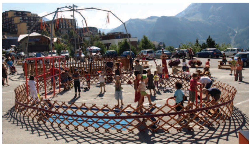
L'espace d'initiation des Z'étoiles du cirque Galaxy.

Une école de cirque pas comme les autres ! L'équipe des Z'étoiles du cirque Galaxy donne rendez-vous aux Ovillois, le 21 août, dans le parc Charles-de-Gaulle. Au programme : initiation des petits et des grands aux disciplines traditionnelles circaciennes. Encadré par des professionnels du cirque, chacun pourra, dans un espace sécurisé, s'essayer à des disciplines nombreuses et variées : exercices d'équilibre (fil de fer, petites échasses,