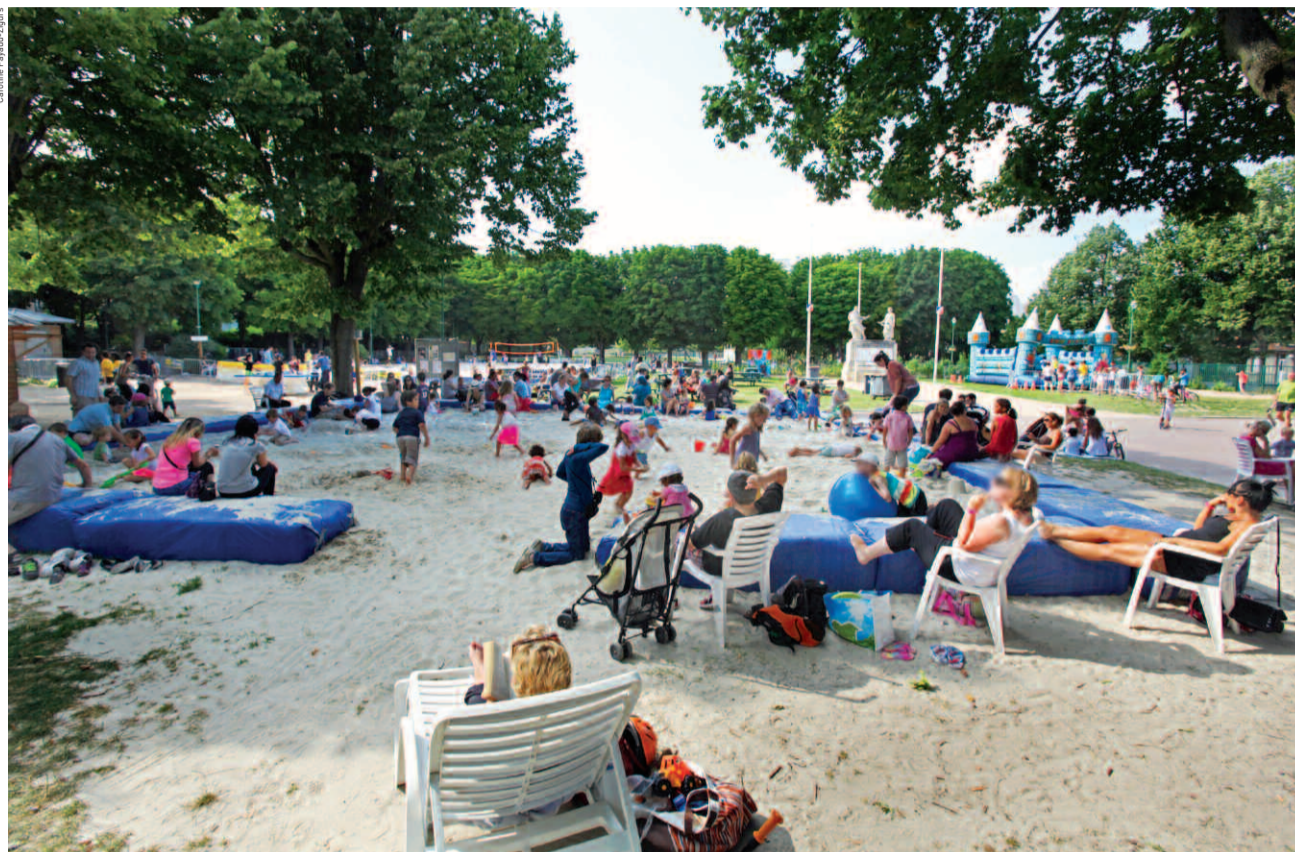
Houilles Plage offre à un large public un programme diversifié d'animations sportives, ludiques et culturelles.

Du 16 juin au 6 septembre, la 7 e édition de Houilles Plage vivra à l'heure brésilienne. Batucada, capoeira et ballon rond seront de la partie.