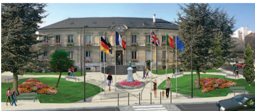
Projet de réaménagement du parvis de l'hôtel de ville.

Parvis de l'hôtel de ville. L'aménagement du parvis de l'hôtel de ville et de ses abords, dont les travaux ont commencé en mai dernier, s'achèvera début septembre. Les Ovillois pourront alors profiter d'un espace mis en valeur par des îlots de verdure, un circuit de promenade équipé de bancs publics et un nouveau matériel urbain.