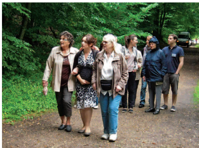
Moments partagés de convivialité entre étudiants et seniors.

Coordination gérontologique Méandre de la Seine (20, place Michelet). Renseignements au 01 30 86 93 89. Courriel : cgl@meandredealseine.fr