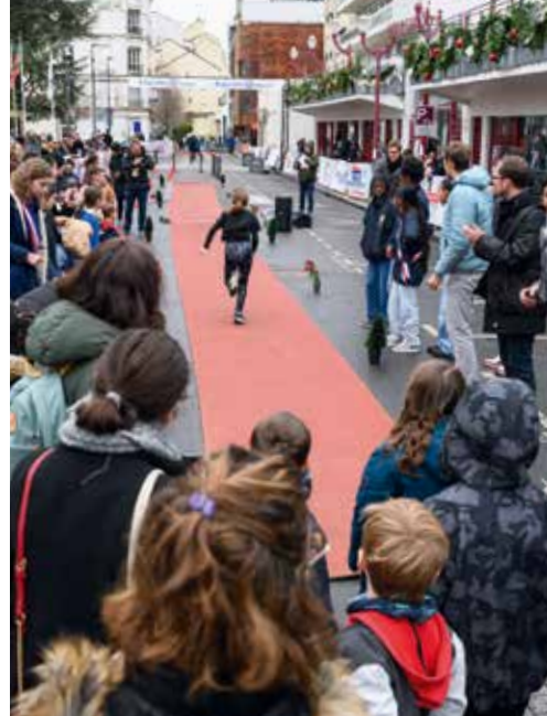
Le départ de la course populaire.