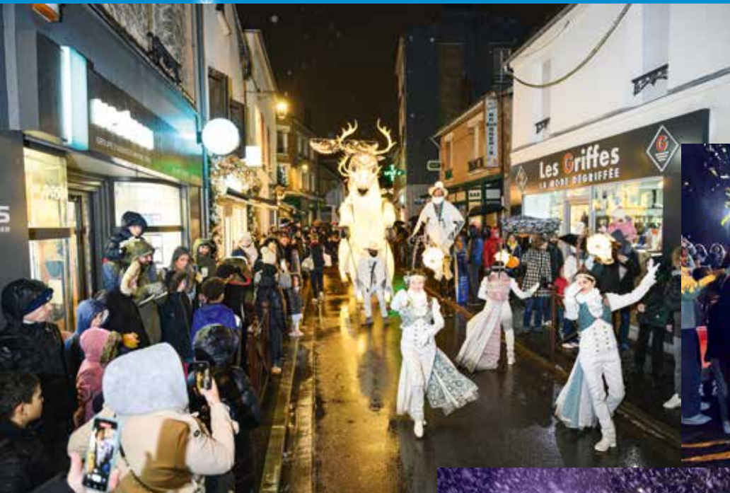
L'inauguration du village de Noël (ci-dessous).