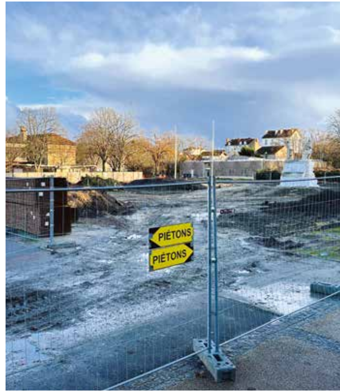
Sur le chantier du parc Charles-de-Gaulle, l'heure est au terrassement.

Un cheminement piéton a été créé afin que les Ovillois puissent continuer de traverser le parc et de profiter des espaces encore ouverts. Seul le portail du côté de la rue Gambetta est fermé au public. Les entrées par l'allée Toussaint, le parking Durantin, la rue de Marne, la rue de Verdun et l'avenue Charles-de-Gaulle restent ouvertes. Pour accéder à la crèche Les Choupiissons, les parents doivent passer par l'avenue Charles-de-Gaulle, la rue de Verdun ou la rue de la Marne. L'Ovillois Mag se fera l'écho des modifications à venir sur les accès, au fil de l'avancement du projet.