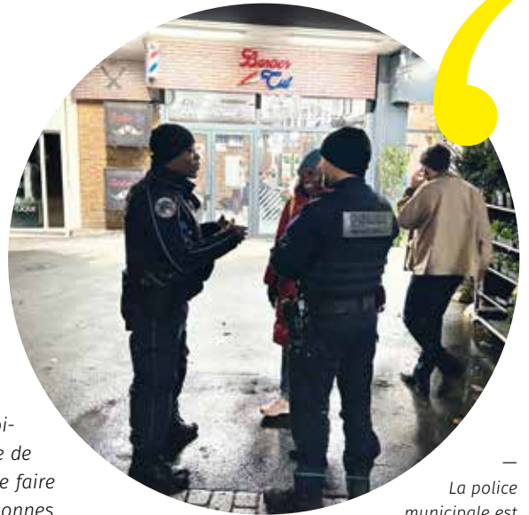
La police municipale est une police de proximité.

si les policiers nationaux ont des prérogatives spécifiques en matière d'enquête, cette complémentarité, facilitée par la présence d'un commissariat à Houilles, s'exprime davantage aujourd'hui et c'est dans le cadre de cette collaboration que des opérations communes sont montées. Je pense par exemple à la surveillance des lieux de culte de Houilles et aux opérations de sécurisation à la gare que nous effectuons conjointement avec la police nationale dans le cadre du plan Vigipirate. Nous travaillons en bonne intelligence. »