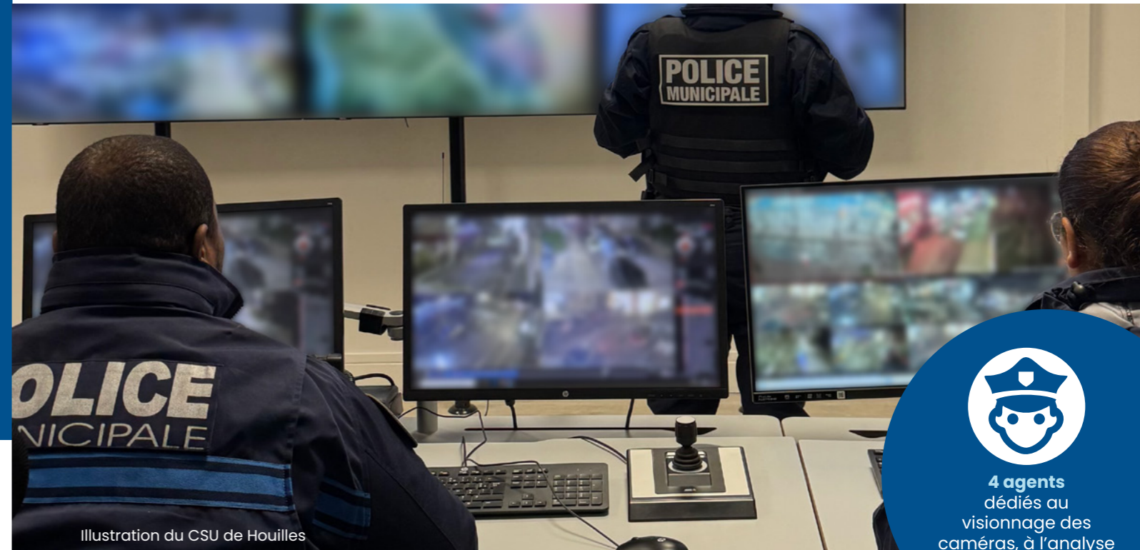
Illustration du CSU de Houilles

Convention communale de coordination, permettant l'armement de nos policiers, signée le 26/03/2023.