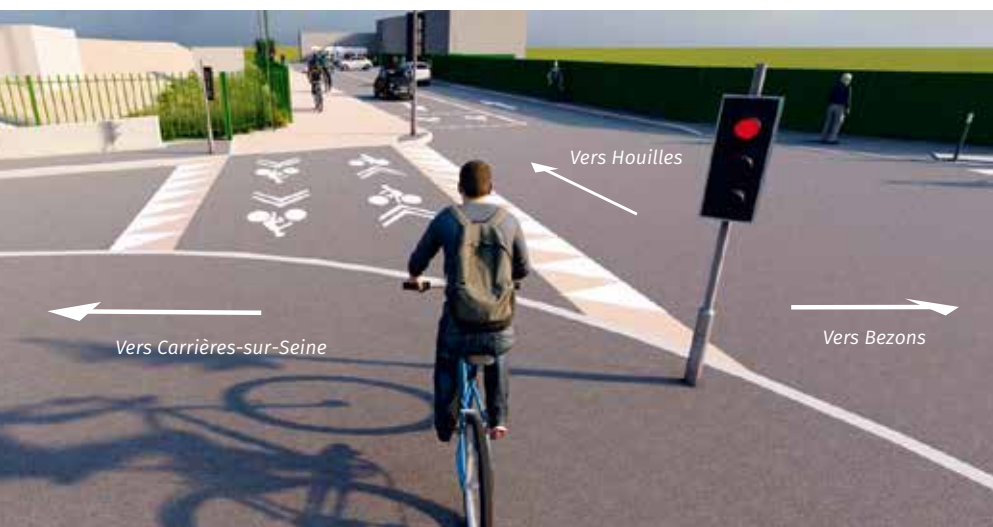
Future traversée cyclable surélevée en sortant de la passerelle Eole.

aux travaux d'aménagement des routes. Ils auront lieu à Houilles d'octobre 2025 à janvier 2026 le long des voies SNCF. Tout d'abord, rue de la Paix (à partir de la rue Edison) puis rue Robespierre après la pose des murs acoustiques dans le cadre de l'arrivée du RER E (Eole). Ces travaux prévoient notamment de créer une piste cyclable bidirectionnelle, de rénover les chaussées et d'élargir les trottoirs du côté des maisons.