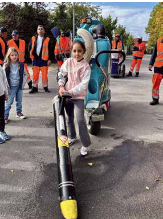
Le Glutton a eu beaucoup de succès!