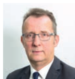
Patrick Carmier Urbanisme