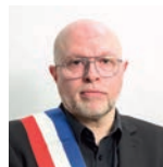
Stéphane Brand Culture

Secrétariat du Maire et des élus : Tél. : 0130 86 32 12