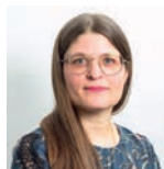
Floriane Charlot Archives, Mémoire et Anciens combattants