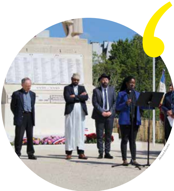
Les représentants des cultes.