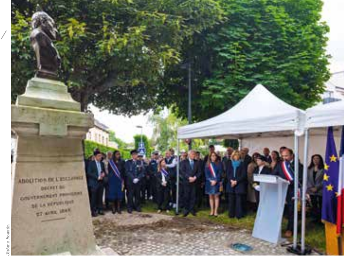
Le 10 mai, place Schœlcher.